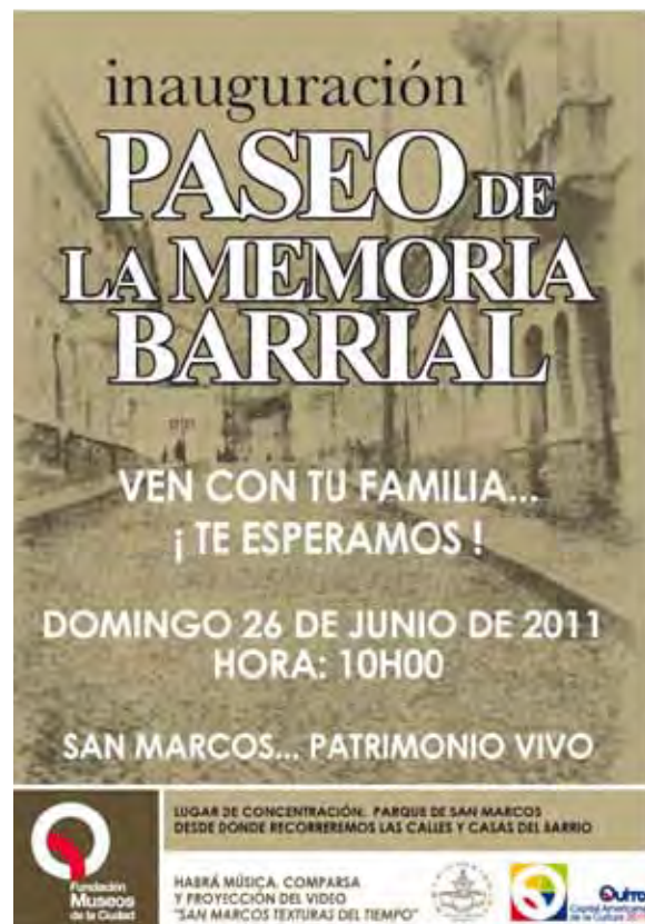
Afiche para la inauguración de las placas sobre la memoria del barrio San Marcos