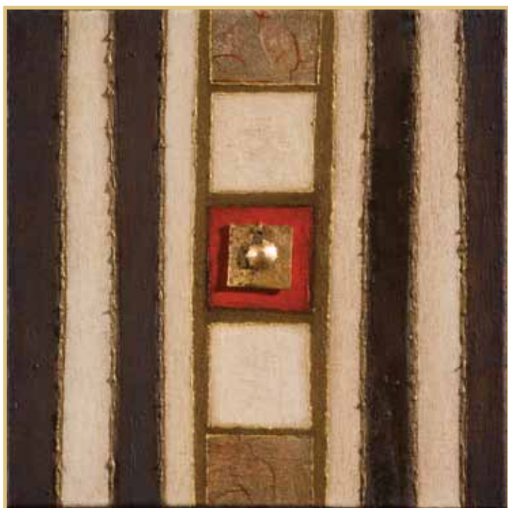
Unitario - 2010 20 x 20 cm

Este proceso dialógico, por tanto, saldrá, en 2012, de una relación ‘museos/ comunidades/barrios participantes’ a una integración al imaginario simbólico y real del Distrito Metropolitano de Quito.